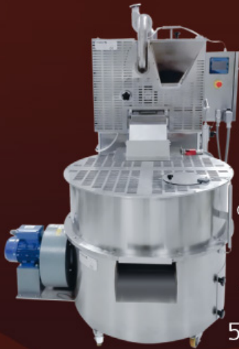
TOSTINO TORREFACTEUR TOSTADOR