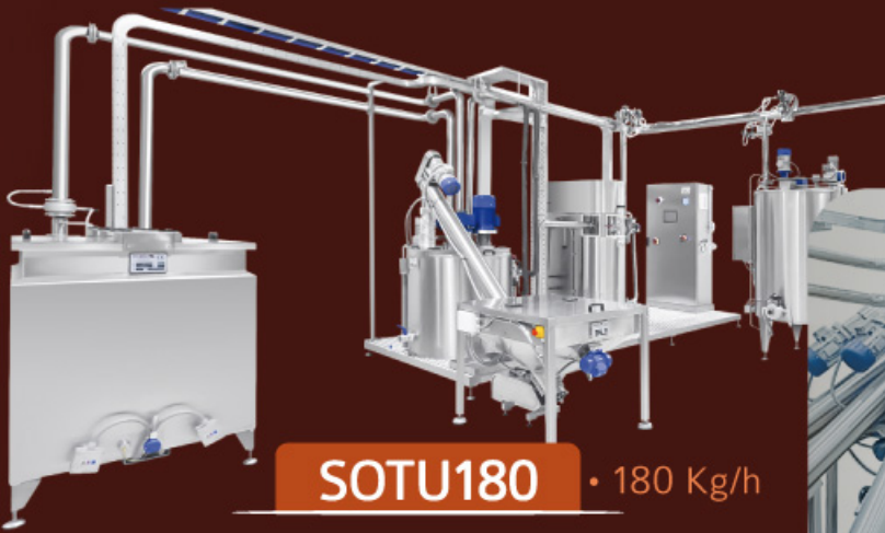
SOTU180 • 180 Kg/h

• Preparation of ingredients, refining, conching and storage • Preparazione degli ingredienti, raffinazione, concaggio e stoccaggio • Préparation des ingrédients, raffinage, conchage et stockage • Preparación de ingredientes, refinado, conchado y almacenamiento