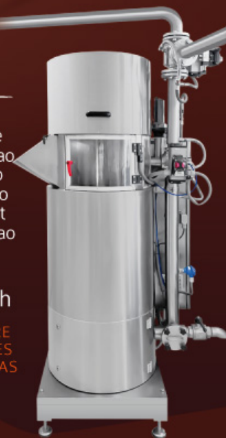
MULINO A SFERE MOULIN À BILLES MOLINO DE BOLAS