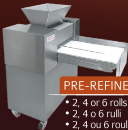
PRE-RAFFINATRICE PRE-BROYEUSE PRE-REFINADORA