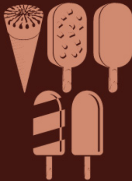
CHOCOLATE FOR ICE CREAM