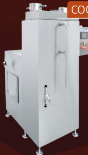
VIBROVAGLIO ELEVATO TAMIS ÉLEVÉ VIBRO-TAMIZADOR ELEVADO