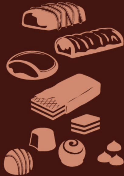
BAKERY AND PASTRY CHOCOLATE