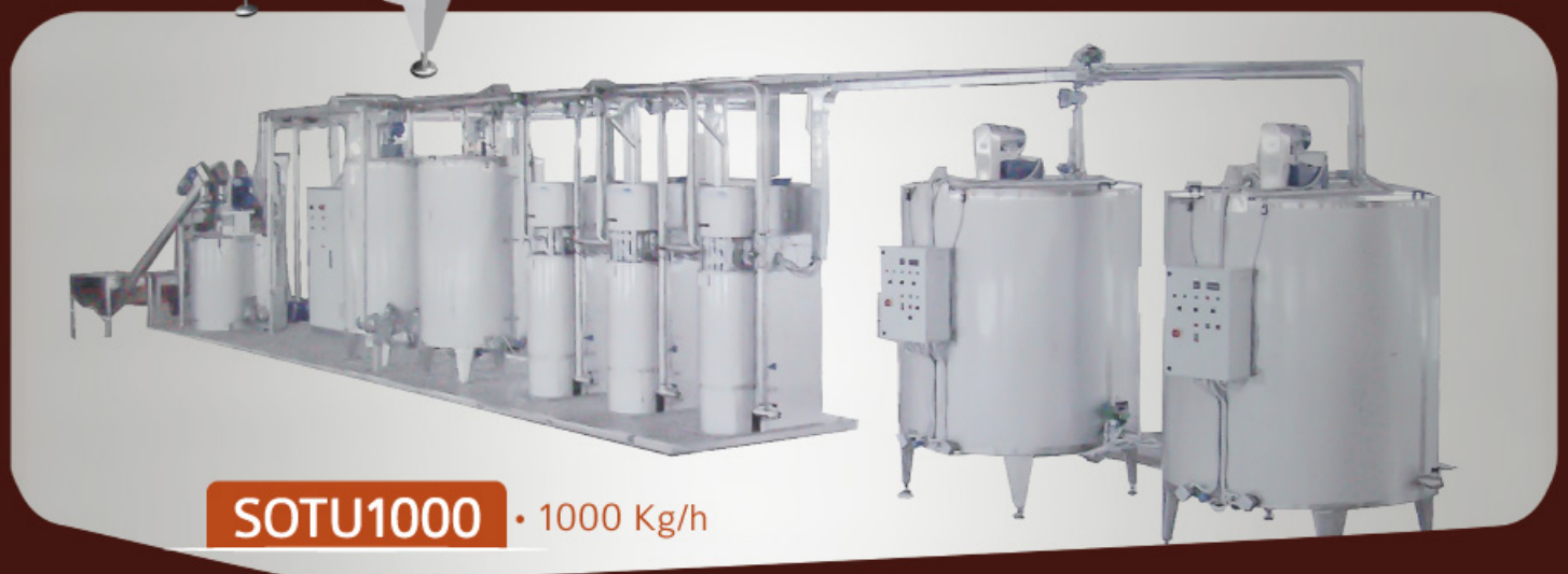
SOTU1000 • 1000 Kg/h