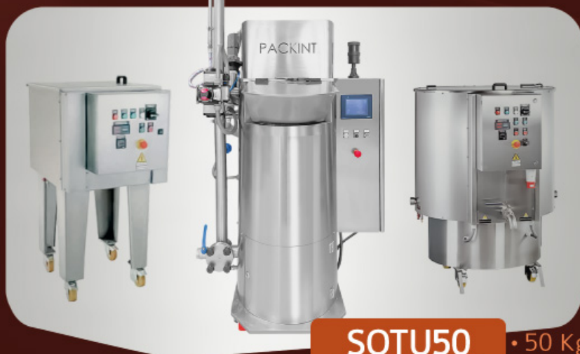
SOTU50 • 50 Kg/h