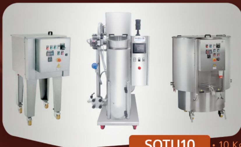
SOTU10 • 10 Kg/h