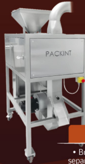
ROMPICACAO CONCASSEUR DESCASCARILLADOR