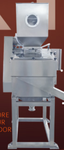
SPIETRATORE EPIERREUR DESPEDRADOR