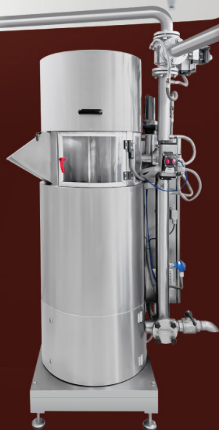
LOW SPEED BALL REFINER • 10 Kg/h • 50 Kg/h • 100 Kg/h • 250 Kg/h MULINO A SFERE A BASSA VELOCITÀ MOULIN À BILLES À BASSE VITESSE MOLINO DE BOLAS A BAJA VELOCIDAD