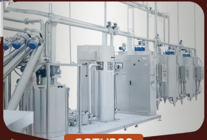
SOTU300 • 300 Kg/h