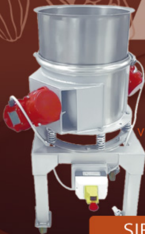
VIBROVAGLIO TAMIS VIBRO-TAMIZADOR