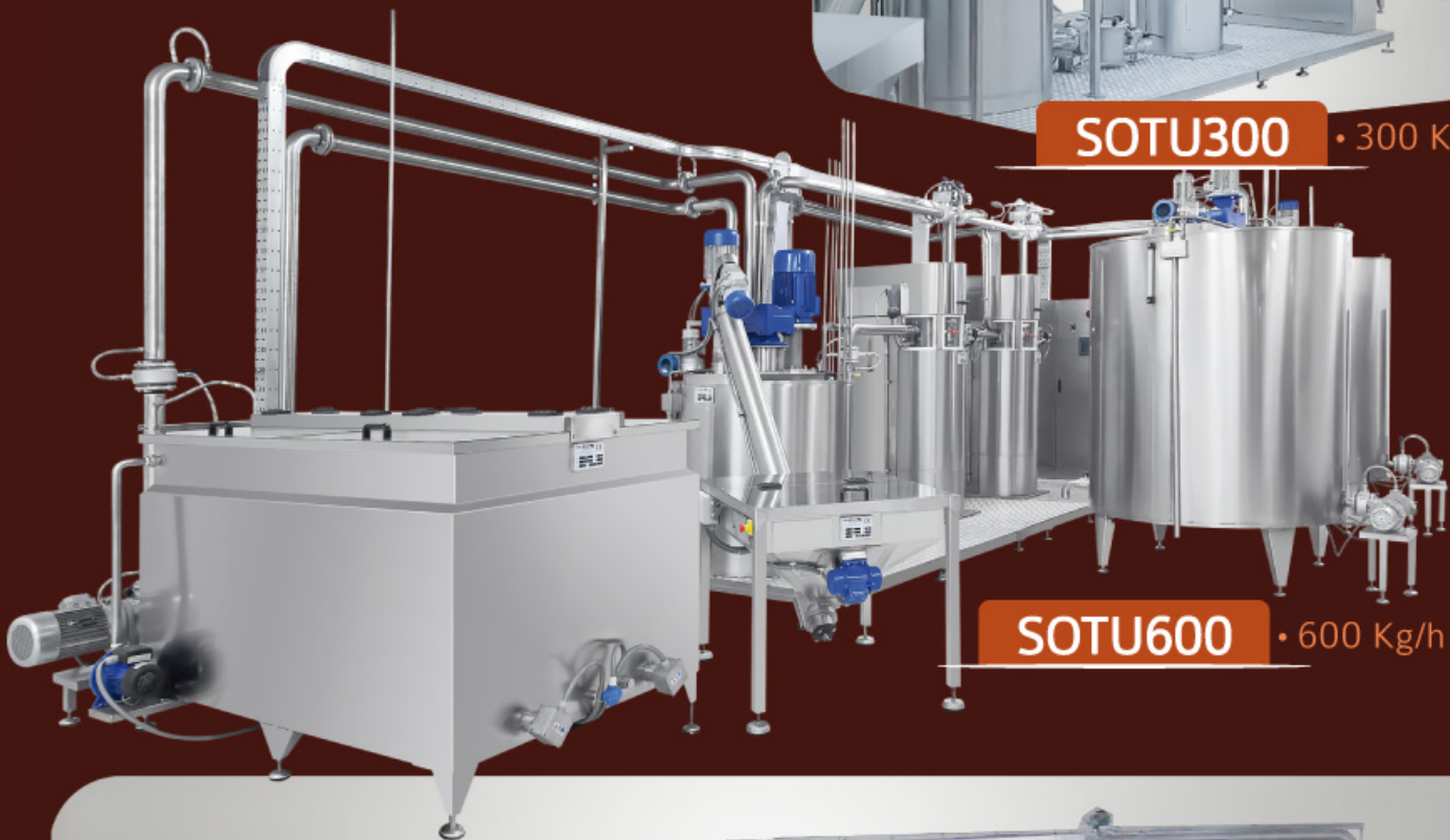
SOTU600 • 600 Kg/h