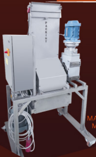
FRANGIPANI MACHINE POUR CASSER LES BLOQUES MAQUINA PARA ROMPER BLOQUES