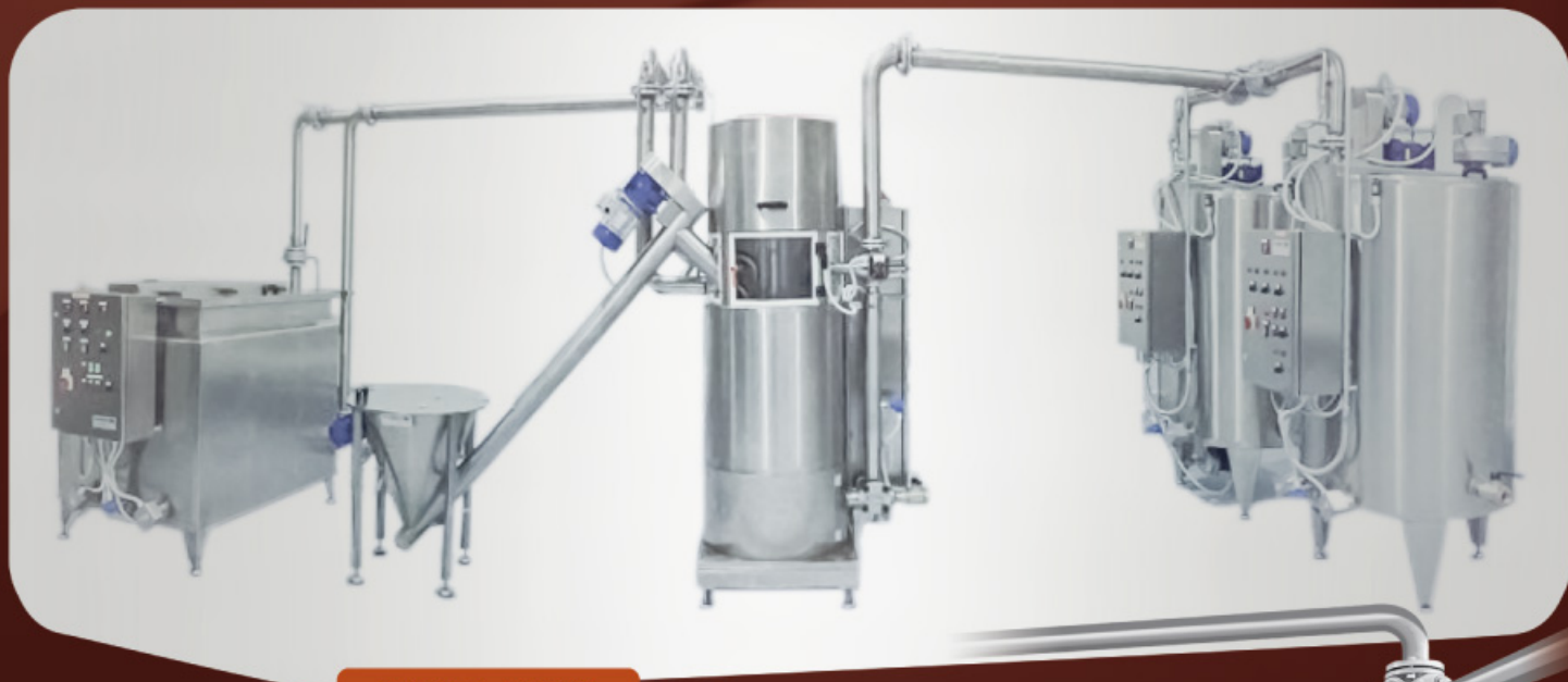
SOTU100 • 100 Kg/h

• LINEE PER CIOCCOLATO E CREME SPALMABILI • LIGNES POUR CHOCOLAT ET PÂTES À TARTINER • LÍNEAS PARA CHOCOLATE Y CREMAS PARA UNTAR