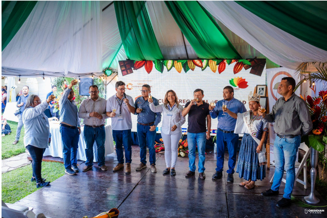
Fuente: Miembros de SICACAO dando cierre al Salón de Cacao y Chocolate SICACAO 2024, junto a la actual Ratzum Kakaw 2024