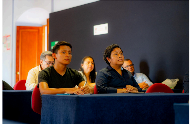
El Reglamento EUDR es una medida importante para combatir la deforestación global y promover la sostenibilidad en la producción de materias primas, ara el comercio regional de cacao, representa un desafío y una oportunidad