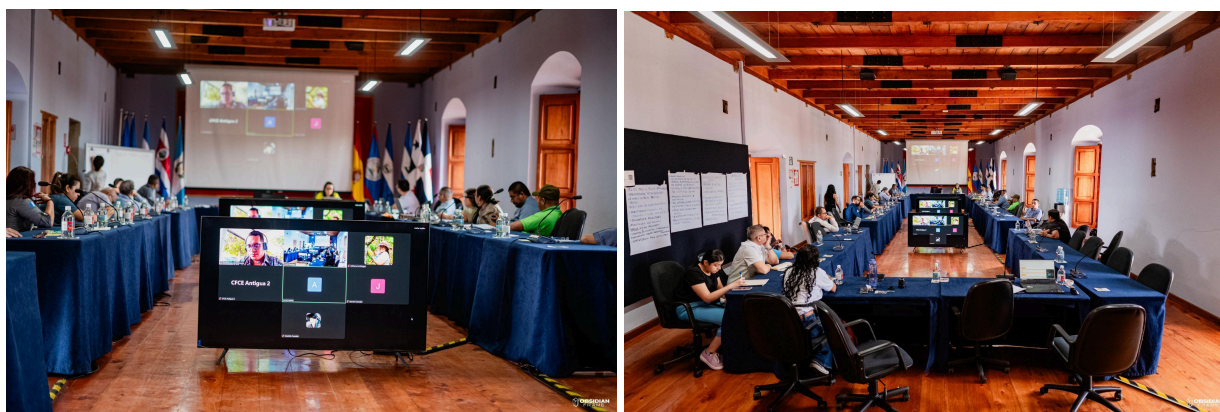
Fuente: Reunión por parte de la Coordinadora y Sub Coordinadora de la comisión del concurso calidad cacao y chocolate hacia miembros Comité Regional para presentar resultados