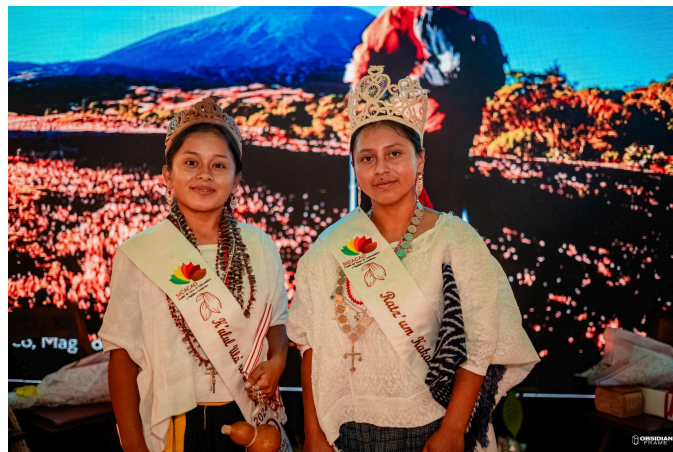
Fuente: ganadoras con el I lugar la representante de Cobán, Alta Verapaz y con el II lugar la del municipio de Panzós, Alta Verapaz.

En el concurso de la Ratzum Kakaw, de alcance nacional, participaron seis señoritas provenientes de igual número de municipios de Guatemala. En este concurso se evaluaron entre otras cosas el conocimiento del cacao, su relación con la cultura ancestral, los conocimientos y prácticas de la cultura de cada una de las representantes.