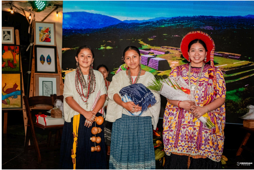
Fuente: Señoritas seleccionadas para el fallo final