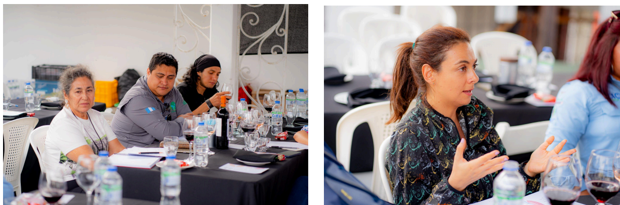
Fuente: participantes descubriendo cómo el cacao puede transformarse en un componente fascinante de la vinificación, guiados a través de la historia y la evolución de esta innovadora técnica y cómo el cacao aporta una dimensión única al vino.