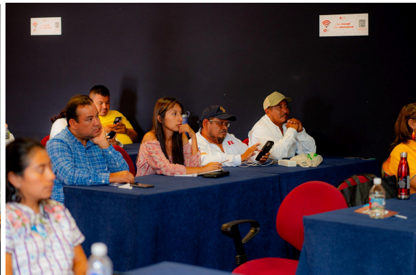
Fuentes: las historias expuestas demuestran cómo los jóvenes están impactando positivamente la cadena de valor del cacao a través de la innovación, el emprendimiento, la tecnología y la educación. Su éxito no solo contribuye a la sostenibilidad y el desarrollo económico en sus comunidades, sino que también inspira a otros a explorar nuevas oportunidades y adoptar prácticas más responsables en la industria del cacao.