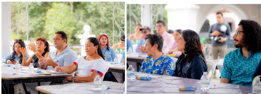
Fuente: Participantes en la preparación de cócteles con bebidas de chocolate, aprendiendo las técnicas esenciales para preparar cócteles de chocolate, incluyendo el equilibrio de sabores, el uso de mezcladores y la presentación de las bebidas.